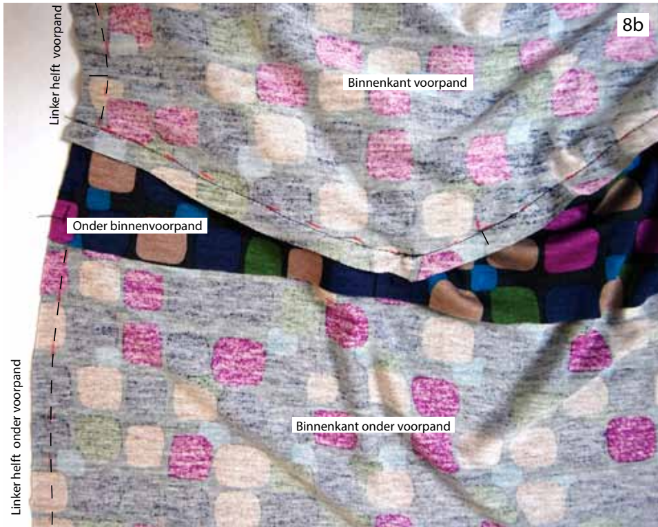
Foto 8b Stik het voorpand op deze lijn van het linker onder binnenvoorpand vast.