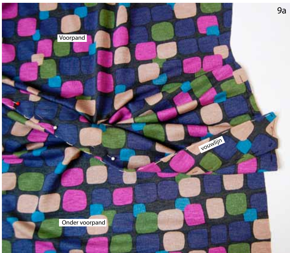
Foto 9a Vouw het onder voorpand naar beneden. Vouw het onder voorpand op de aangegeven vouwlijn naar binnen en speld hem vast.

Foto 8b Stik het voorpand op deze lijn van het linker onder binnenvoorpand vast.