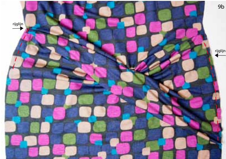
Foto 9b Rijg de zijranden van het onder voorpand vast.