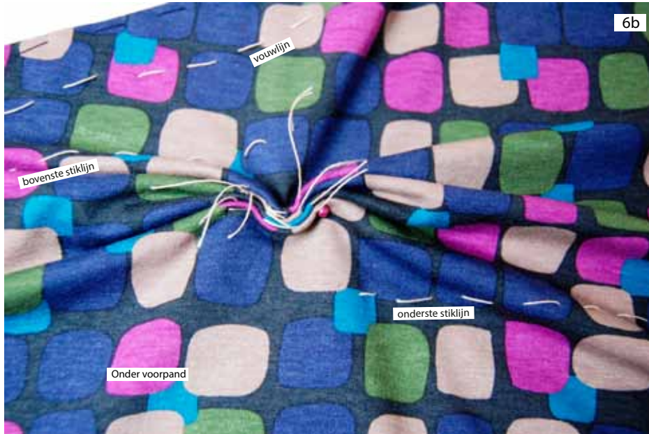
Foto 6b Leg de 4 vouwlijnen van het onder voorpand op elkaar en speld ze op elkaar vast.