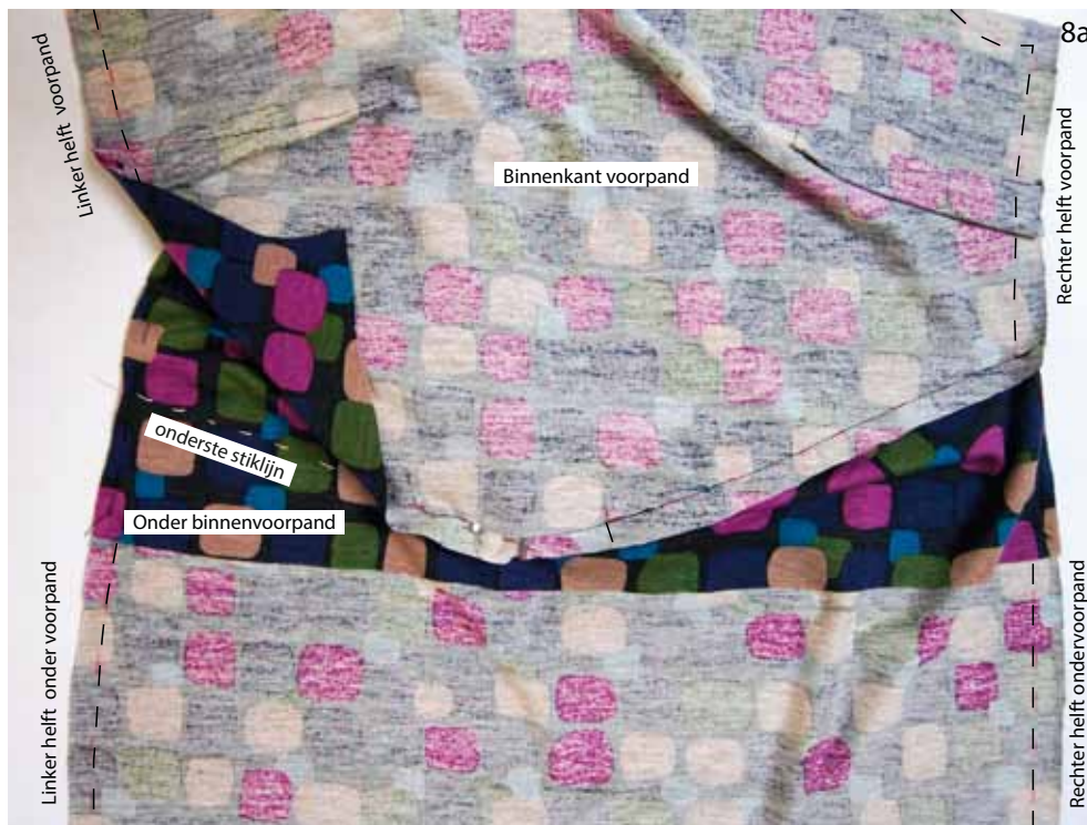
Foto 8a Leg de onderrand van de linker helft van het voorpand met de goede kant op de aangegeven onderste stiklijn van het linker onder binnenvoorpand en speld hem vast.

Foto 7 Leg de onderrand van de rechter helft van het voorpand met de goede kant op de aangegeven bovenste stiklijn op het rechter onder binnenvoorpand. Speld en stik het voorpand op deze lijn van het rechter onder binnenvoorpand vast.