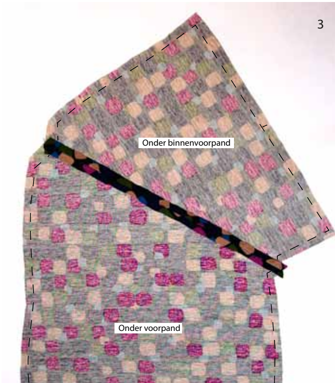
Foto 3 Strijk de naden open.