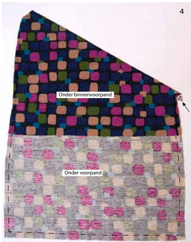
Foto 4 Vouw de panden met de verkeerde kanten op elkaar en rijg ze langs de buitenrand op elkaar vast. Knip eventueel de naden gelijk af. Verwerk de panden verder als één ondervoorpand.