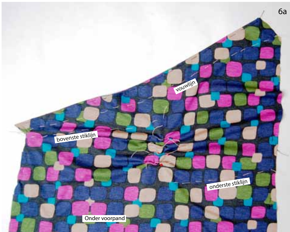
Foto 6a Vouw het ondervoorpand op de aangegeven vouwlijn dubbel en speld hem 0,5 cm onder de vouwlijn vast. Vouw zo ook de overige 3 vouwlijnen dubbel en speld ze vast.

Foto 5 Geef met een rijgdraad de vouwlijnen en de overige lijnen op het ondervoorpand aan.