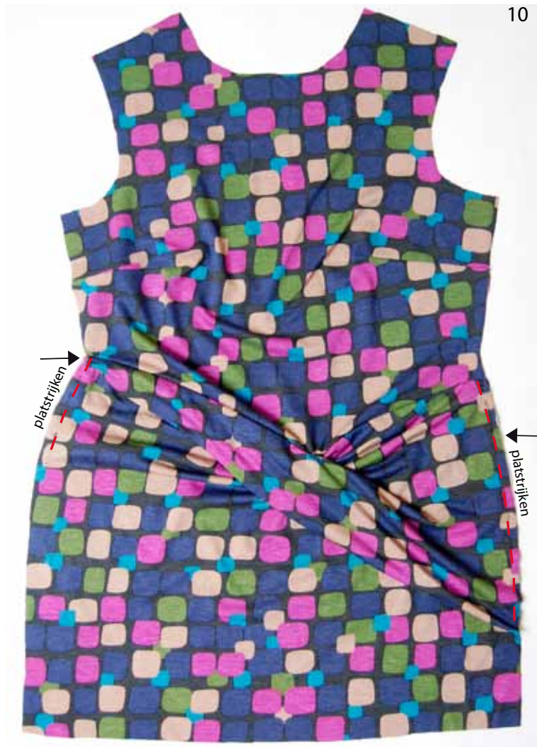
Foto 10 Strijk de zijnaden van de panden een klein stukje plat.

Foto 9b Rijg de zijranden van het onder voorpand vast.