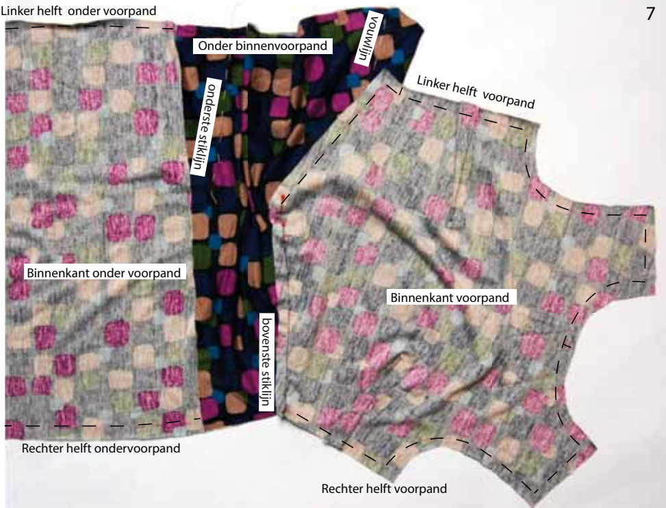
Foto 7 Leg de onderrand van de rechter helft van het voorpand met de goede kant op de aangegeven bovenste stiklijn op het rechter onder binnenvoorpand. Speld en stik het voorpand op deze lijn van het rechter onder binnenvoorpand vast.