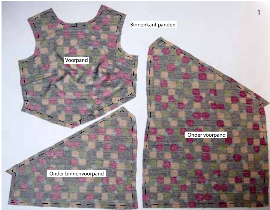
Foto 1 Geef met een kleermakerspotlood de buitenrand van het voorpand, het onder voorpand en het onder binnenvoorpand aan. *Stik de figurnaden in het voorpand.