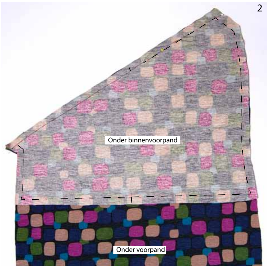
Foto 2 Leg het onder binnenvoorpand en het ondervoorpand met de goede kanten op elkaar. Speld en stik de panden langs de bovenrand op elkaar.

Foto 1 Geef met een kleermakerspotlood de buitenrand van het voorpand, het onder voorpand en het onder binnenvoorpand aan. *Stik de figurnaden in het voorpand.